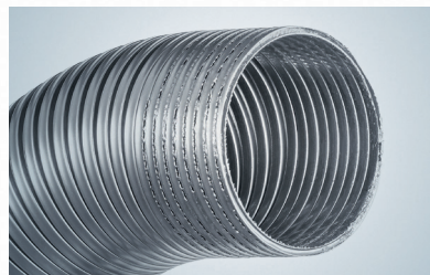
Das patentierte Laserschweißverfahren erlaubt den Zuschnitt ohne Abwickeln