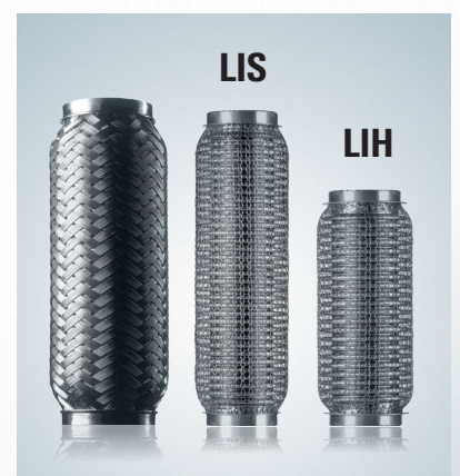
Flex Evolution für gleiche Leistung in engerem Bauraum